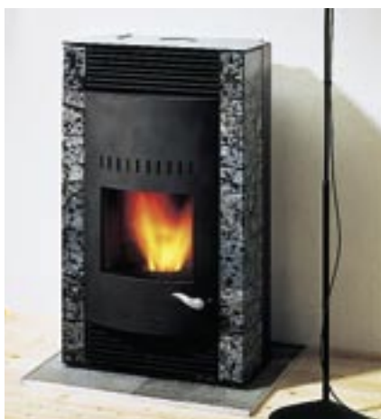
Stufa a pellets: caricamento manuale, funzionamento automatico.