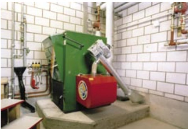
Una caldaia a pellets per edifici abitativi e commerciali.

Stufa a pellets: I piccoli impianti a pellets erogano una potenza di 2 a 11 kW. Esternamente assomigliano alle stufe a legna classiche. Tuttavia, a differenza di quest'ultime, il loro funzionamento è automatico e, in genere, regolato da un termostato che misura la temperatura del locale. L'accensione avviene tramite un interruttore e il sistema di regolazione, comandato da un microprocessore, apre e chiude le clappe dell'aria. Per il gestore, l'unica incombenza è quindi il caricamento del combustibile, lo svuotamento delle ceneri e la pulizia. Grazie a grandi contenitori