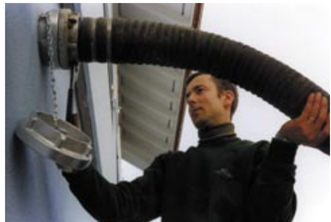
Fornitura di pellets con autocisterna.